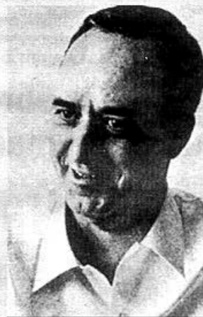
Josep Ferrater Móra

derat un dels grans filòsofs catalans d'aquest segle, és autor d'una obra bàsicament assagística, sobre la metafísica, el llenguatge i la lògica matemàtica, que va evolucionar progressivament cap a un contingut existencialista. Una de les seves obres més àmplies és el Diccionari de Filosofia . Les formes de la vida catalana és probablement la seva obra més popular. El hombre en la encrucijada , El ser y la muerte , Tres mundos: Cataluña, España, Europa i La filosofía en el món d'avui , són alguns dels seus títols.