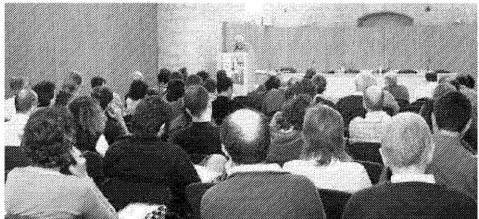
Una imatge d'una de les conferències, amb Tugendhat al fons.