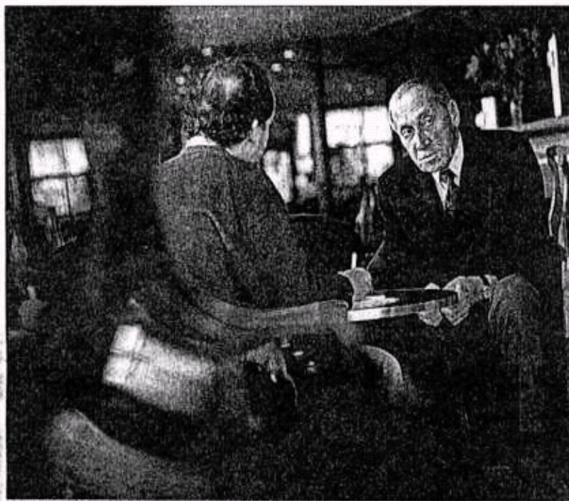
El filósofo Leszek Kolakowski durante su estancia en Girona.

su gulag , es el comunismo en su definición marxista. No quiero decir que sea el responsable de la construcción de los gulag , no era esa su intención, pero es bien cierto que muchos pensadores del siglo XIX, sobre todo los anarquistas, anticiparon perfectamente, y antes de la Revolución Rusa, que el socialismo según la idea de Marx conduciría a la esclavitud.