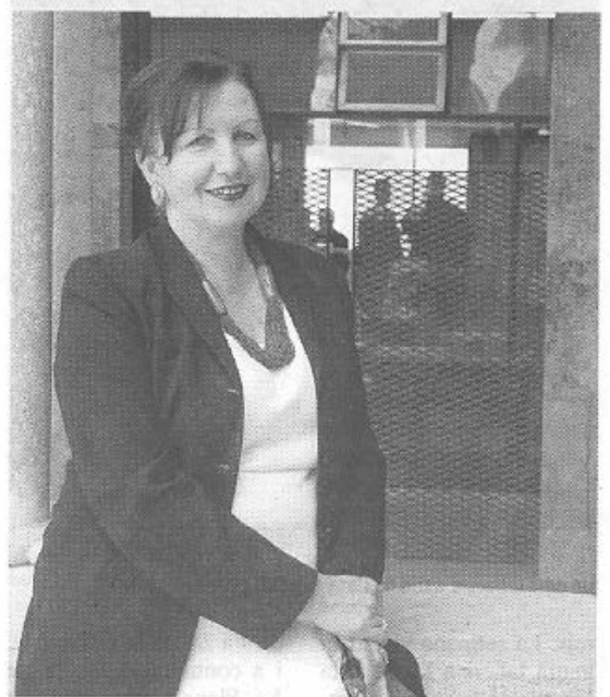
Seyla Benhabib, ahir al claustre de la Facultat de Lletres.

Aquesta pensadora, també molt reconeguda com a feminista, ha escrit diferents llibres, com ara Teoría feminista y teoría crítica , El reluctant modernismo de Hannah Arendt: el diàleg con Martin Heidegger i The Claims of Culture: Equality and Diversity in the Global Era .