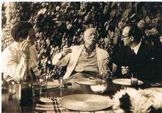
Eliade i Jung al Cercle Eranos (Ascona -Suïssa)