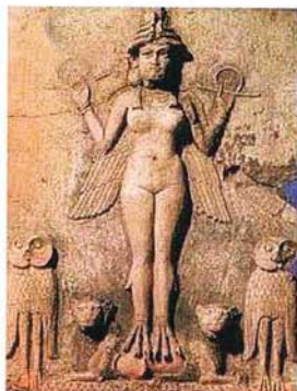
Inana senyora del cel i de la terra