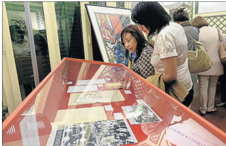
L'exposició sobre Octavio Paz amb la portada de La Vanguardia