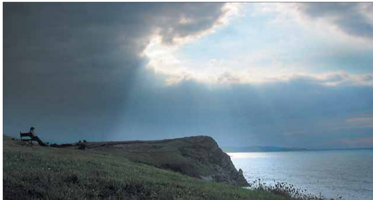
Un jove contempla l'horitzó des d'un penya-segat.

Com animals ferits, no ja per la modernitat, sinó per la racionalitat, els conservadors es revolten tot promovent el retorn, no a determinat sistema polític del passat, sinó a una forma de vida en què la política no seria necessària. Però això els aboca a la contradicció, en aquest cas no només aparent sinó constitutiva i irresoluble, d'argumentar a favor de l'opció de tornar a un estat de coses en què els arguments i les opcions lliures eren irrelevants. Un absurd que sovint ha denunciat Zygmunt Bauman, i que també és aplicable a Heidegger, un dels autors en què, tal com es recorda en aquest llibre, sovint s'ha inspirat, de manera més o menys explícita, el conservadurisme contemporani. El pensador alemany diu que ens hem d'esmerçar per anul·lar la importància de la voluntat humana de conèixer i transformar el món. Però, ¿com es fa això, si no és justament a través d'un suplement de força de voluntat...!?