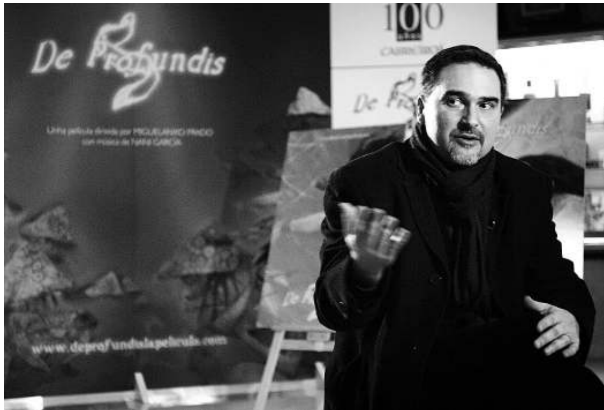
Miguelanxo Prado, la setmana passada en la presentació de la pel·lícula De profundis.