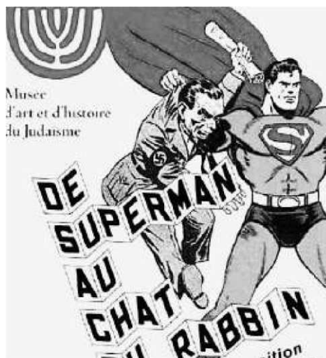
El cartell de l'exposició sobre còmic i judaisme, a París.